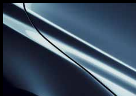
ETERNAL BLUE (45B)*