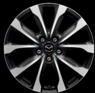
JANTES EN ALLIAGE 18" DIAMOND CUT 'SILVER/GUNMETAL'