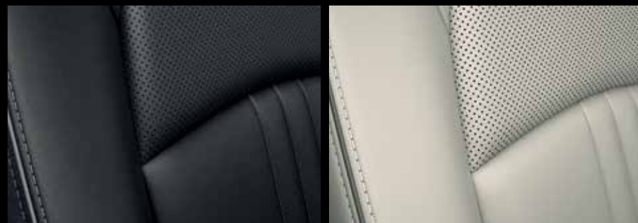
CUIR NOIR AVEC SURPIQÛRES CONTRASTANTES (SKYCRUISE)