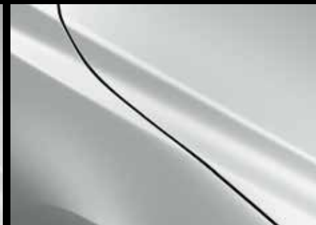
SNOWFLAKE WHITE (25D)*