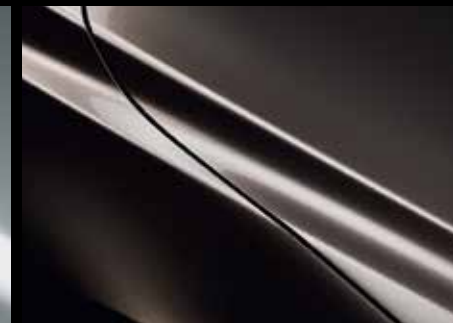
TITANIUM FLASH (42S)*