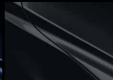
JET BLACK (41W)*