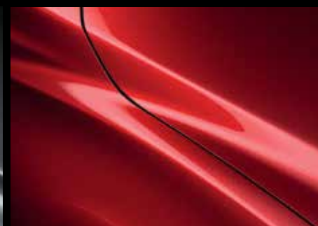
SOUL RED CRYSTAL (46V)*