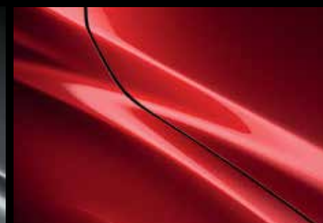
SOUL RED CRYSTAL (46V)*