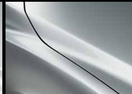
CERAMIC WHITE (47A)*