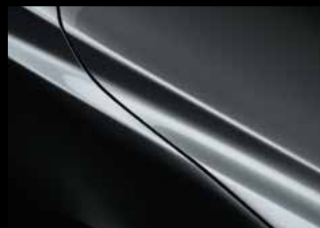
MACHINE GREY (46G)*