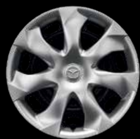
JANTE EN ACIER 16" AVEC ENJOLIVEUR