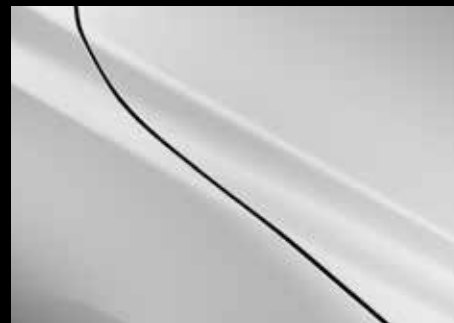
ARCTIC WHITE (A4D)