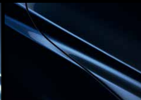
DEEP CRYSTAL BLUE (42M)*