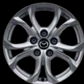
JANTE EN ALLIAGE 16" 'SILVER'