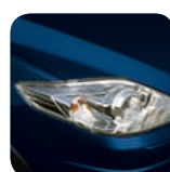
Stormy Blue Mica* (35J)