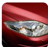
Copper Red Mica* (32V)