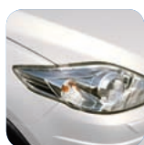
Crystal White Pearl Mica* (34K)