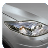
Aluminium Metallic* (38P)