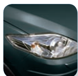
Metropolitan Grey Mica* (36C)