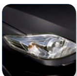
Sparkling Black Mica* (35N)