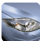
Clear Water Blue Mica* (40B)