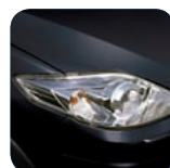
Brilliant Black (A3F)